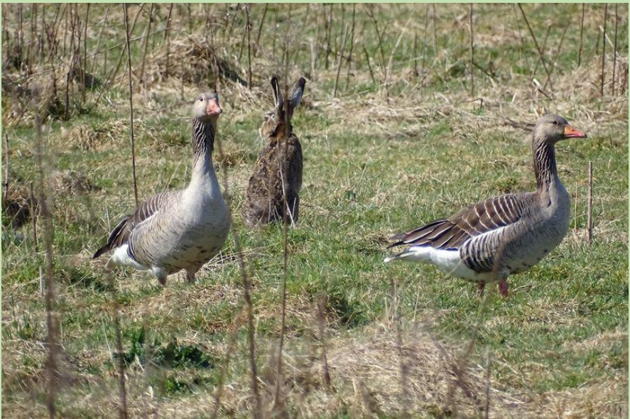
Haas en grauwe ganzen gebroederlijk naast elkaar

heen de roep van scholeksters, Kievitten en wulpen. Het geluid dat zo typisch is voor de weidsheid van dit landschap. De aanblik wordt verstoord door de aaneengesloten grijze wand van het bedrijventerrein. Jammer. We lopen verder langs het water waar grauwe ganzen, smienten en kuifeenden te zien zijn. Binnenkort kunnen vogels zich weer tegoed doen aan de vele libelles en waterjuffers. Het blijft een voedselketen, eten en gegeten worden. De unieke biotoop, onder andere vanwege de mest van de paarden die hier lopen, zorgt ervoor dat hier heel bijzondere insecten zitten. De meidoorns en sleedoorns vormen een ideale verstoppespeelplaats voor kleine vogels. Ze zijn nu al nauwelijks te zien, maar de groene specht verradt zich door zijn prachtige verenkleed. Op de terugweg vatten de dakpannen op een boerderij de sfeer van dit weidse gebied treffend samen: Hoeve Ruimzicht.