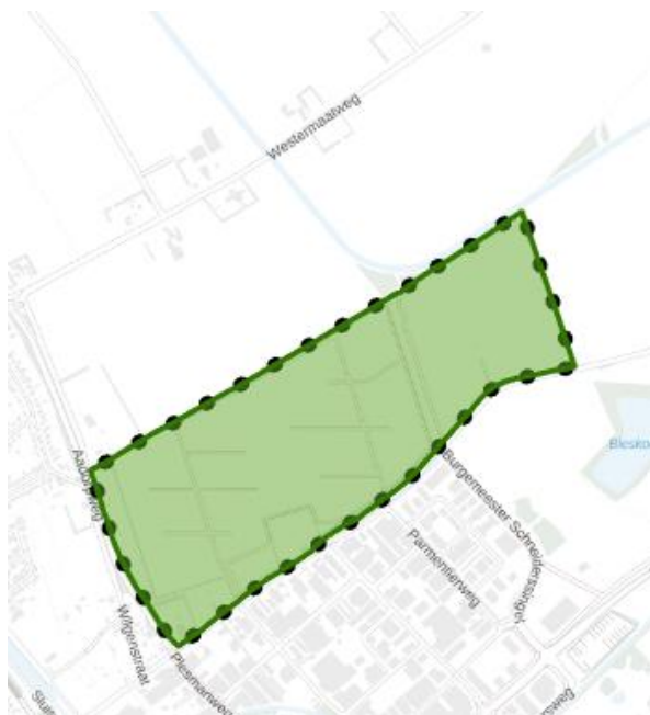
Afbeelding 1 locatie "voorbeschermingsregels Aalanderveld"

Ter uitvoering van de geformuleerde kaders in de Gebiedsvisie Aalanderveld, zoals door u op 24 juni 2025 vastgesteld, hebben wij besloten om een voorbereidingsbesluit te nemen voor de locatie "voorbeschermingsregels Aalanderveld". Afbeelding 1 geeft het gebied weer: